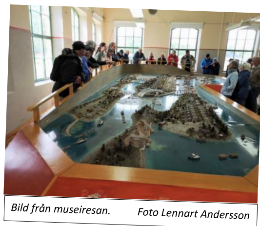
Bild från museiresan.